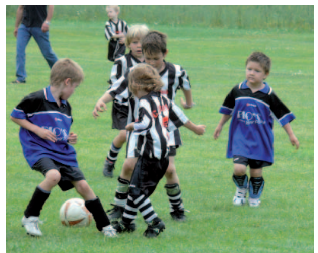
G-Jugend -FC Stoffen gegen FC Hofstetten