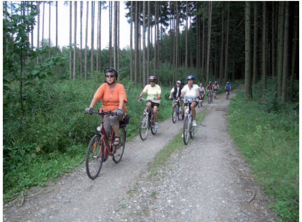
Was gibt es schöneres, als bei hohen Temperaturen durch den kühlen Wald zu radeln? Na ja, gibt es schon, aber das ist ein anderes Thema.

Wer sich zum Thema Radfahren und Gesundheit informieren möchte, findet unter den nachstehenden Internetadressen zweckdienliche Hinweise.