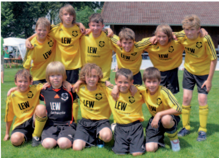
E-Jugend Turniersieger FC Stoffen