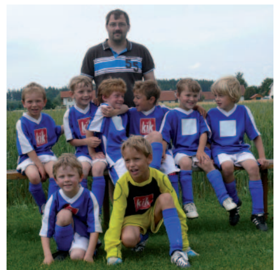
G-Jugend Turniersieger FC Utting