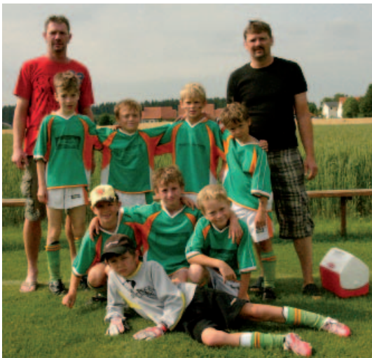
F-Jugend Turniersieger FC Issing