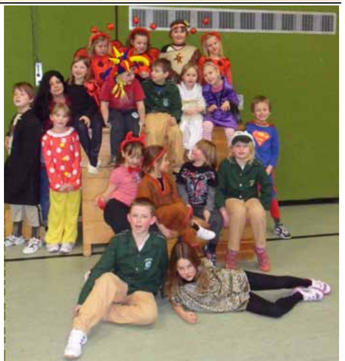
Viel Spaß hatten die Turnkinder der beiden Montagsgruppen des SVL beim diesjährigen Faschingsturnen in der Mehrzweckhalle. Wir freuen uns auf viele neue "Schnupperkinder".