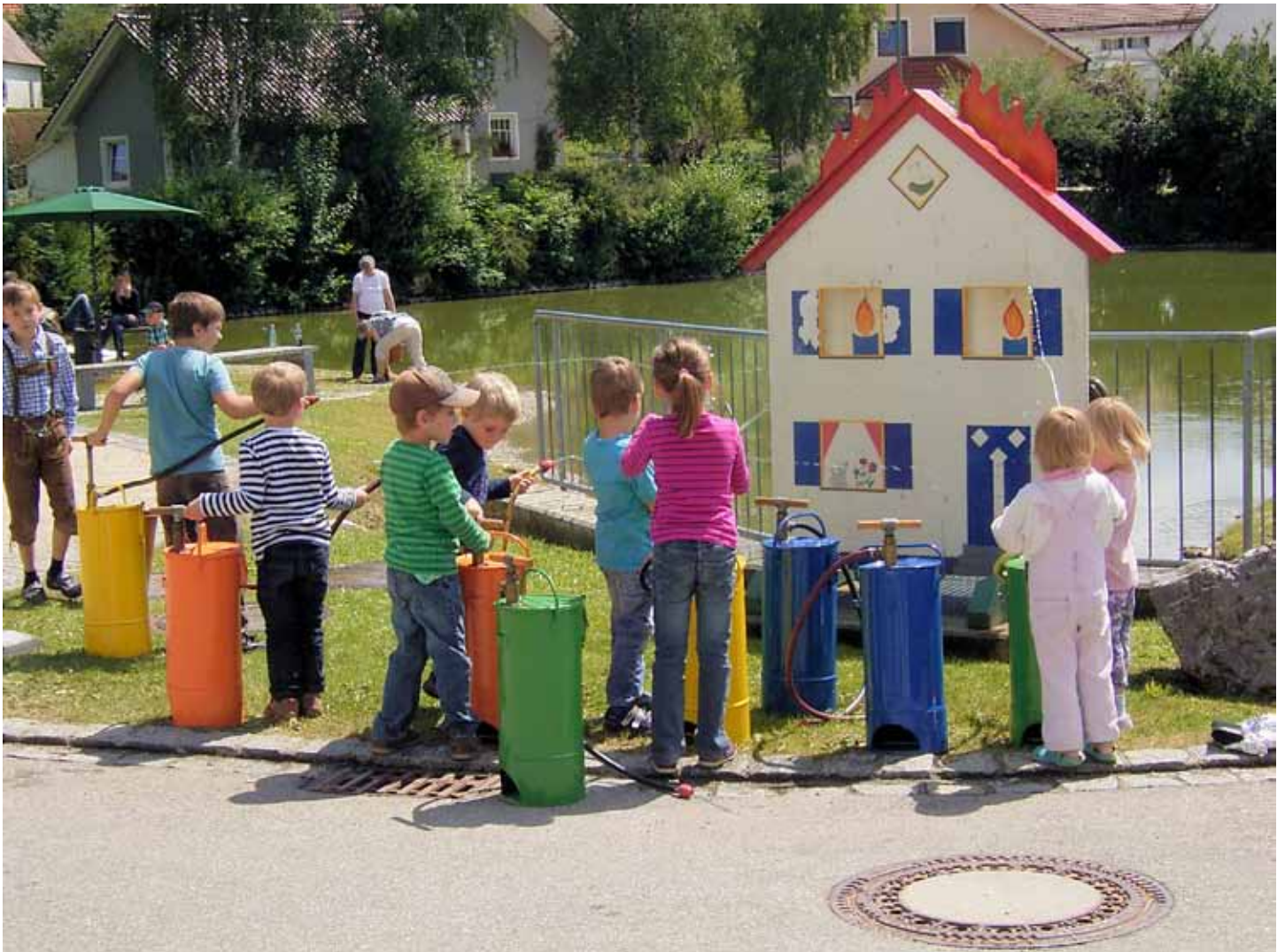
... gesehen beim Doprfest in Pürgen von Martina Engel