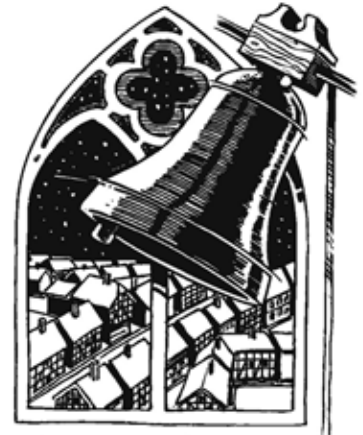
Jahresabschlussandacht Meine Zeit ist in Gottes Händen: Alles Warum, Wann, Wo und Wozu meines Lebens.

10:00 Uhr Hg FESTGOTTESDIENST 10:00 Uhr St FESTGOTTESDIENST 19:00 Uhr Hf FESTGOTTESDIENST 19:00 Uhr Pü FESTGOTTESDIENST