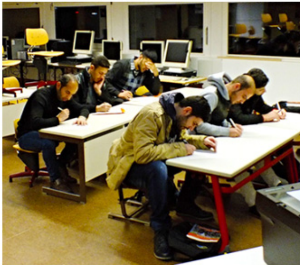
Eifrig und konzentriert lernen die Asylbewerber Deutsch

(Ein naher Freund ist besser als ein ferner Bruder: as-sahib al-qarib afdal min al-ach al-ba'id)