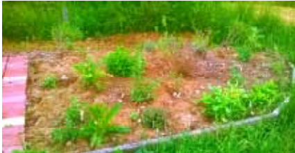
Kräuterbeet im Juni 2015 und im Mai 2016

Der Wettergott hat es 2015 nicht gut mit uns gemeint, deshalb dürfen wir erst heuer unser öffentliches Kräuterbeet auf der Streuobstwiese in Pürgen einweihen.