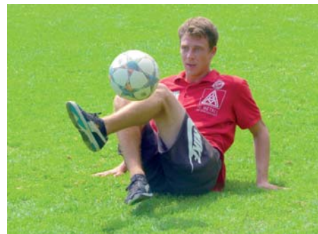
(Bilder: Markus Arnold)