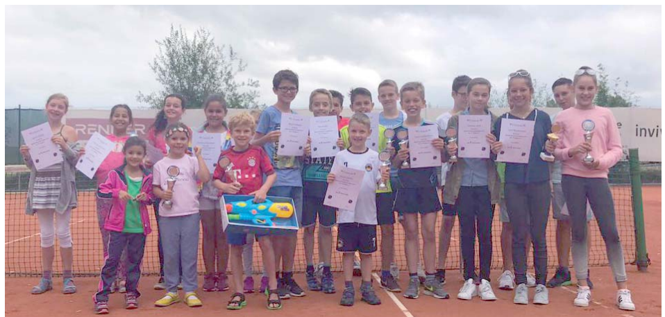
Alle Teilnehmer der Jugendvereinsmeisterschaften des TC Pürgen auf einen Blick.