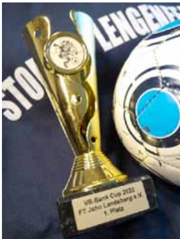
Der Siegerpokal der G-Junioren.

Am 9. Juli endete für unsere Junioren-Mannschaften die Saison 2021/22. Neun Mannschaften von den A- bis zu den F-Junioren nahmen am Ligabetrieb teil. Unsere jüngsten Kicker, die G-Junioren (U7), bestritten mehrere Freundschaftsspiele und Turniere. Beim Turnier der FT Jahn Landsberg konnten unsere Bambini (Vier- bis Sechsjährige) sogar den Siegerpokal mit strahlenden Gesichtern in die Höhe stemmen.